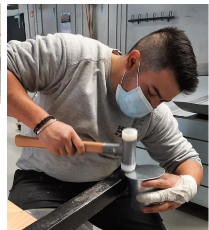
Abbildung 14: Erstellung eines Bechers aus Aluminium- und verzinkten Stahlblech