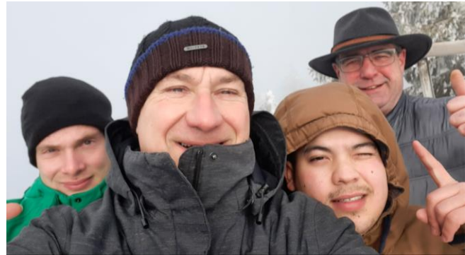
Abbildung 15: Ausflug auf den Dreisessel im Bayerischen Wald

Am Freitag, den 28.01.22 endete leider unser Schüleraustausch. Wir fuhren mit vielen schönen Eindrücken nach Hause. Es war für alle beteiligten Personen eine intensive, arbeitsreiche, aber auch sehr spannende Zeit in unserer Partnerschule Waldkirchen gewesen.