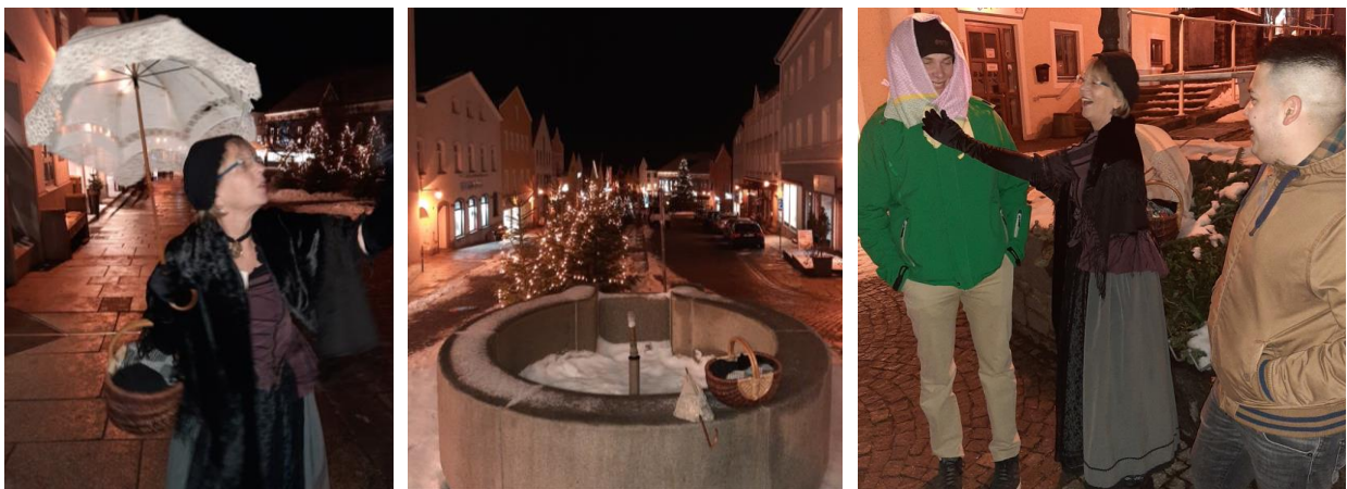
Abbildung 3: Historische Stadtführung durch Waldkirchen

Abends gingen wir zum Marktplatz, an dem uns die Stadtführerin von Waldkirchen in Empfang nahm. Diese führte uns durch die Geschichte von Waldkirchen, erzählte u.a. vom früheren Salzhandel von Passau in Richtung Prag. Die Säumer haben sich hier früher, nach einem Tagesmarsch von Passau kommend, in der Herberge einquartiert. Sie versorgten ihre Pferde, anschließend boten ihnen die Bauern der Umgebung ihre Erzeugnisse feil. Die daraus entstandenen Wochenmärkte sowie der aufblühende Salzhandel brachten schon sehr bald Wohlstand in die Mauern von Waldkirchen. Nach etwa tausendjähriger Entwicklung wurde der Markt 1972 zur Stadt erhoben. Waldkirchen ist heute ein staatlich anerkannter Kur- und Erholungsort mit etwa 10'000 Einwohnern.