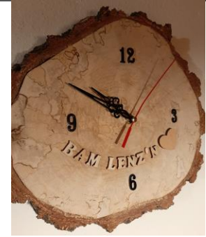
Abbildung 8: Bayerischer Abend beim Lenz'n Wirt.

Am Freitagmorgen arbeiteten wir nach einer Theorieeinführung weiter mit „der deutschen Deckung“. Wir lernten zusammen mit den deutschen Dachdeckerlehrlinge auf was es bei dieser Deckungsart ankommt und wie sie ausgeführt wird.