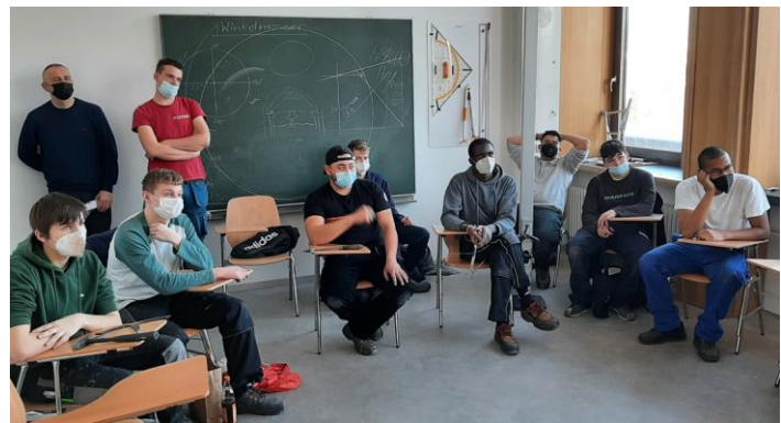
Abbildung 9: Theoretische Ausbildung über das Deutsche Dachdeckerhandwerk

Am Freitagnachmittag fahren wir nach Passau. Als Erstes fahren wir zum Aussichtspunkt, bei dem wir einen schönen Ausblick auf die Stadt hatten. Wir konnten auch die Verschmelzung von Inn und Donau sehen. Unten in der Stadt angekommen, besuchten wir die schöne Altstadt und den berühmten Dom mit der größten Kirchenorgel der Welt. Natürlich durfte ein feines Essen in einem typischen bayerischen Wirtshaus nicht fehlen.