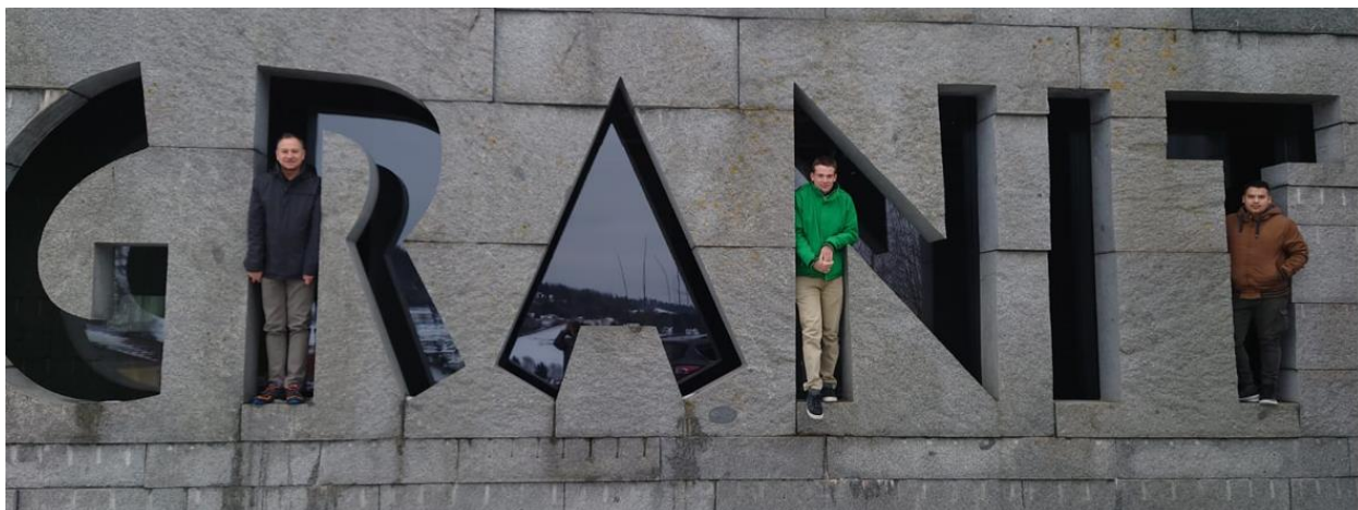
Abbildung 12: Gruppenbild vor dem Granitmuseum

Am Nachmittag besuchten wir das Granit-Museum in Hauzenberg. Der Bayerische Wald ist ein Urgebirge und sein Untergrund besteht komplett aus Granit. Dieser wird immer noch abgebaut und verwertet. Früher wurde der Granit mit Schiffen auf der Donau nach Wien und nach Budapest geführt, viele Prunkbauten und Straßen wurden damit gebaut.