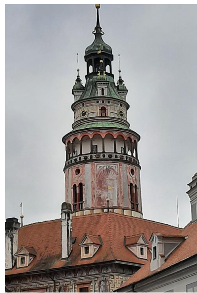
Abbildung 10: Ausflug nach Tschechien mit dem Besuch der Städte Budweis und Krumlov