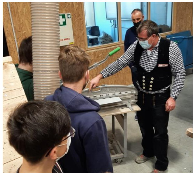
Abbildung 7: Erstellung der Deutschen Deckung

Am Nachmittag fahren wir zur alten Hausbrennerei Penninger welches ein Familienunternehmen mit einer Tradition von 115 Jahren in Waldkirchen beherbergt ist. Dort wurde für uns eine interessante Betriebsführung organisiert. Anschließend ging es weiter zu einem Bauernhof, in welchem uns der Lenz'n Wirt, die bayerische Wirtshauskultur näherbrachte.